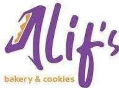
Gambar 3. 1 Logo Alif's Bakery & Cookies

Sebuah Perusahaan harus memiliki identitas dengan tujuan untuk memudahkan konsumen dalam mengenali Perusahaan ataupun produk yang di produksi oleh Perusahaan. Identitas tersebut sering kita sebut sebagai logo.