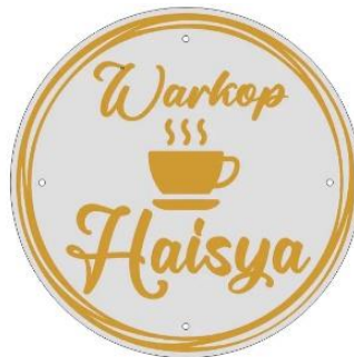
Gambar 3. 1 Logo Perusahaan