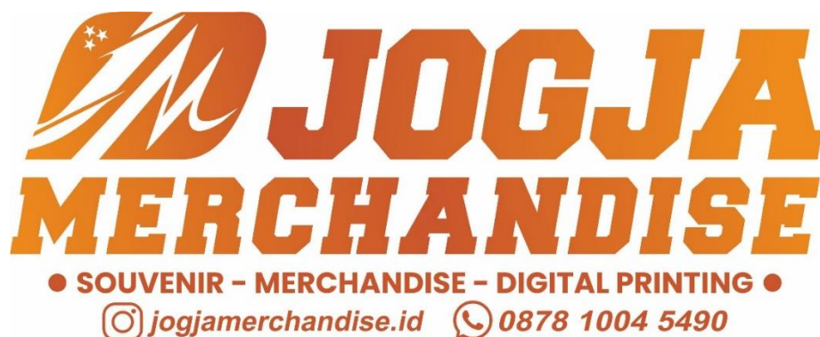
Gambar 3. 1 Logo Perusahaan