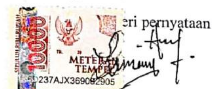
Imaddudin Al Farisyi